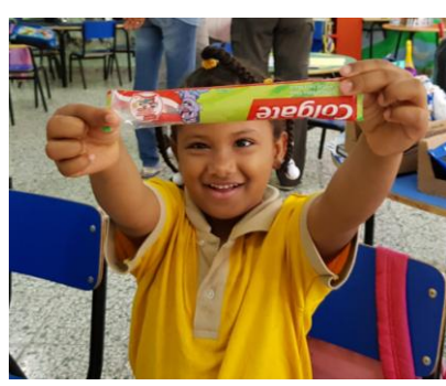
voorlichting en poetsles bij de kleuters.