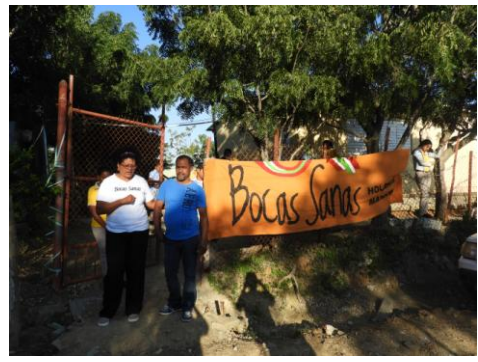
De conciërge heeft de vlag al opgehangen

Het is maar een klein schooltje en we hebben niet veel ruimte in het lokaal.