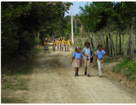
Ook de kinderen komen lopend naar school